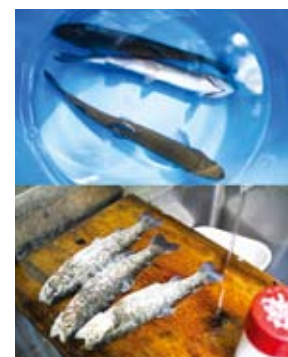
マスのつかみ取り