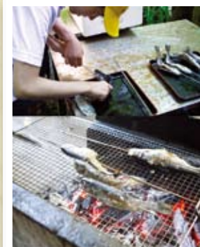
くし打ちして塩焼きに