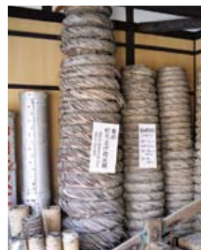
昔の打ち上げ花火