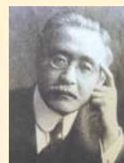
新渡戸 稲造 (にとべいなぞう) 1862年～1933年

りやすく紹介する内容になっています。この本のなかに「仁」(Jin) という字が出てくるのですが、彼はこの字の意味を説明するため、Love (愛) や Sym-pathy (共感) といった言葉を用いています。稲造は、日本人の間に古くから見られた仁の精神を聖書の視点から見つめ直し愛と共感という言葉で、それを世界に紹介しようとしたのかもしれない。 「あなたの隣人を愛せよ」。これは聖書の中心的な教えの一つです。